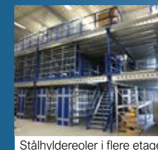
Stålhyldereoler i flere etager