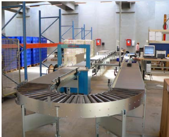
Komplet pakkelinie med strapmaskine