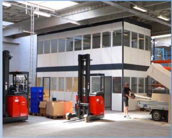
Lagerkontor i 2 etager