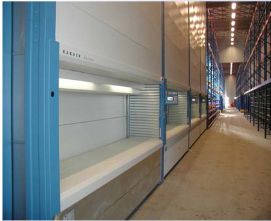
4 lagerautomater med 320 hylder