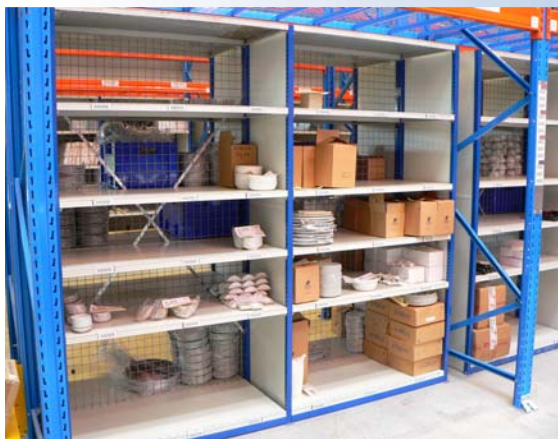
1500 løbende meter stålhylder