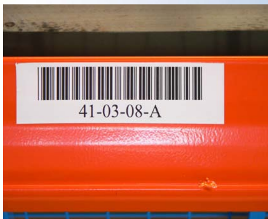
30.000 lokationsmærker med stregkode