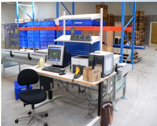
Specialdesignede hæve- /sænke borde