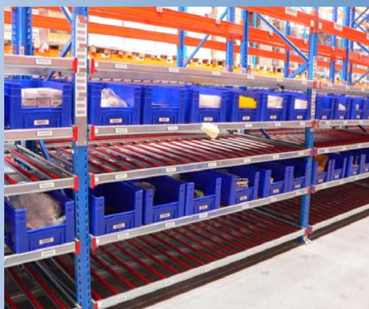
56 rammer indskubsreoler til kasser