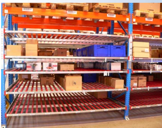
220 rammer gennemløb til kasser