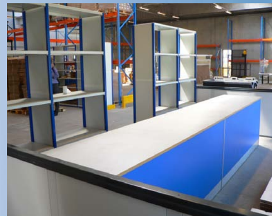
Ekspeditionsområde med disk