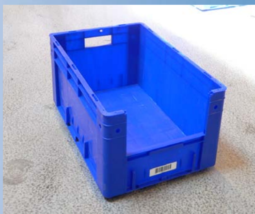
3500 stabelbare plastkasser