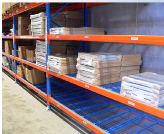
Nethylder til ukurante varer