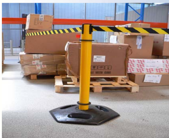
Markering af færdigpakkede ordrer