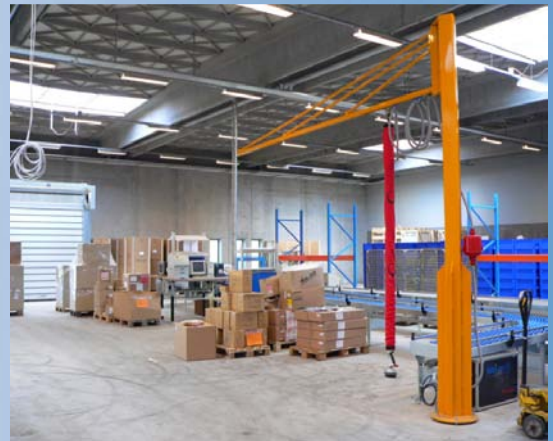
Vacuumløftekran til pakker