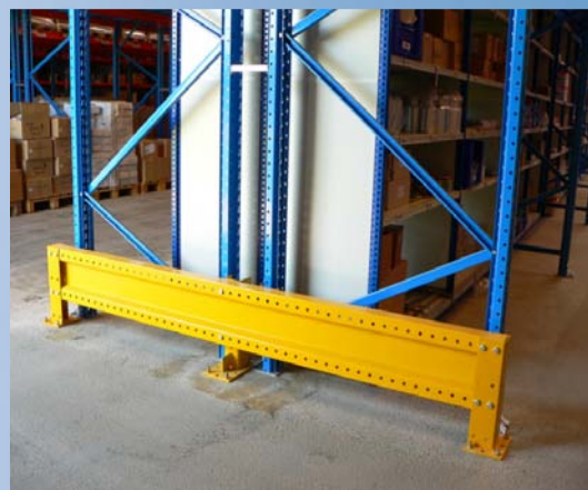
Truckværn til sikring mod påkørsel