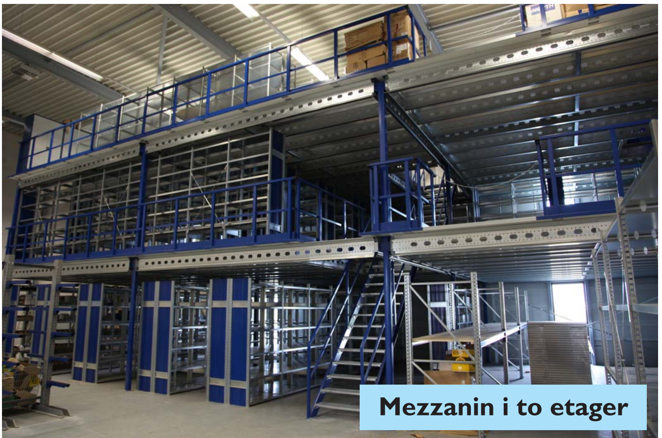
Mezzanin i to etager