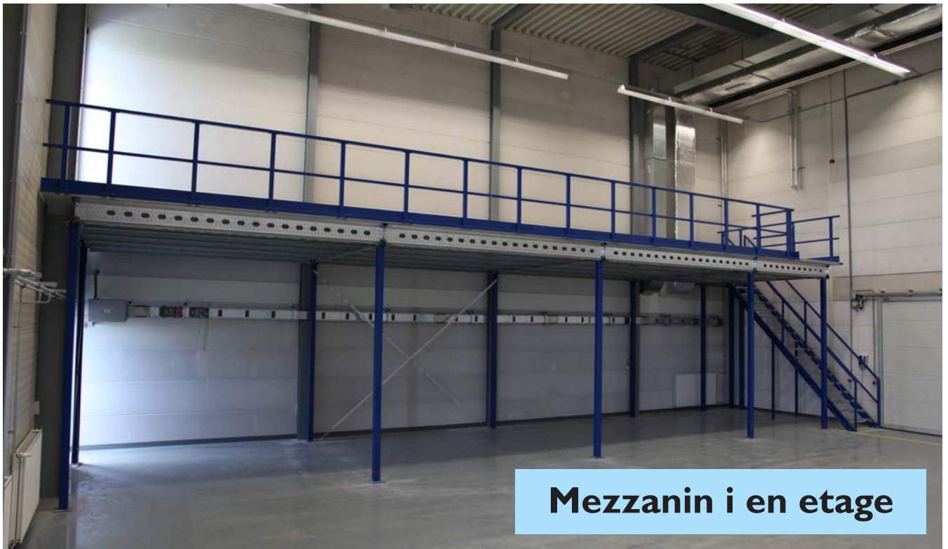
Mezzanin i en etage